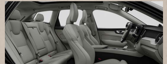
UCO0 B5四驱智雅豪华版 T8四驱长续航智雅豪华版 米色内饰 | 人体工程学米色高级Nappa真皮座椅 White Driftwood白色漂流木内饰条