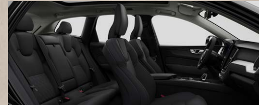
RPO0 B5四驱智逸豪华版 黑色内饰 | 人体工程学曜石黑Nordico®植然皮座椅 Metal Mesh金属网格内饰条