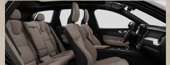
RPE0 B5四驱智逸豪华版 黑色内饰 | 人体工程学豆蔻褐Nordico®植然皮座椅 Metal Mesh金属网格内饰条