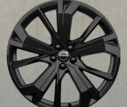
21英寸 极夜黑版 铝合金轮毂