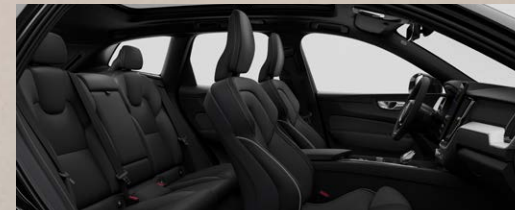
RGOR B5四驱智远极夜黑版 T8四驱长续航智远极夜黑版 黑色内饰 | 人体工程学黑色Nappa真皮+Open Grid织物运动座椅 Metal Mesh金属网格内饰条