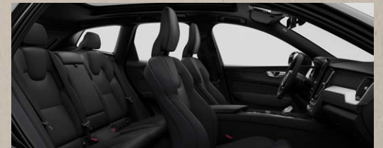
RCO0 B5四驱智远极夜黑版 T8四驱长续航智远极夜黑版 黑色内饰 | 人体工程学黑色高级Nappa真皮座椅 Metal Mesh金属网格内饰条