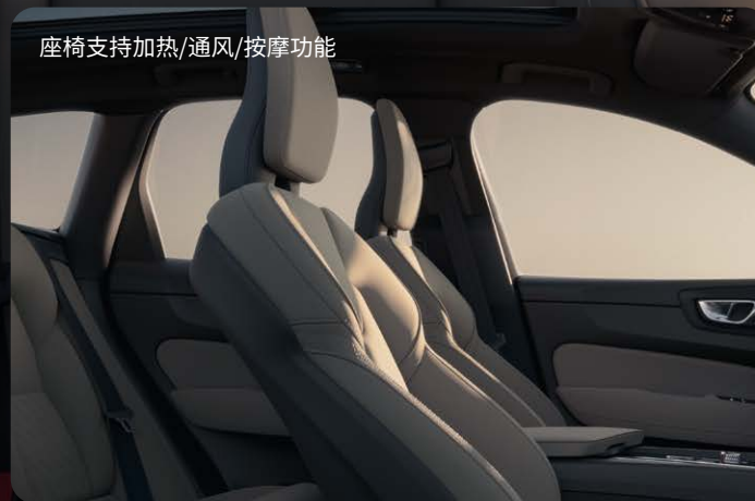
座椅支持加热/通风/按摩功能