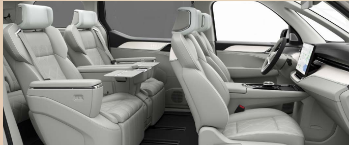
T760 黑色/浅色内饰，人体工程学晨曦白超柔Nappa皮座椅 1 | 桦木竹纹透光饰板