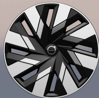
19英寸 8辐 空气动力学轮毂 (含静音轮胎)