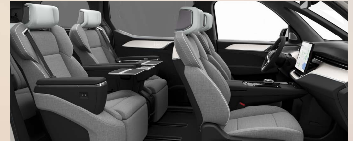
R200 黑色内饰，人体工程学浅色羊毛混纺座椅 2 | 桦木竹纹透光饰板