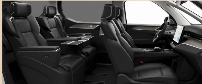
R700 黑色内饰，人体工程学曜石黑超柔Nappa皮座椅 1 | 桦木竹纹透光饰板