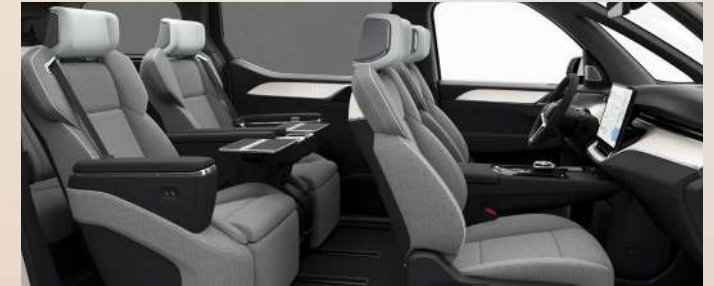
R200 黑色内饰，人体工程学浅色羊毛混纺座椅 2 | 桦木竹纹透光饰板