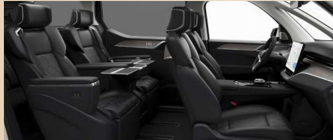
R700 黑色内饰，人体工程学曜石黑超柔Nappa皮座椅 1 | 桦木竹纹透光饰板